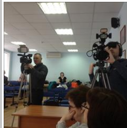
Круглый стол «О ходе реализации мероприятий по проведению независимой оценки качества оказания услуг Вопросы качества социальных услуг заинтересовали и представителей СМИ города Котласа