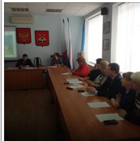
Круглый стол «О ходе реализации мероприятий по проведению независимой оценки качества оказания услуг В преддверии мартовских выборов на круглом столе рассмотрены и вопросы доступности избирательных