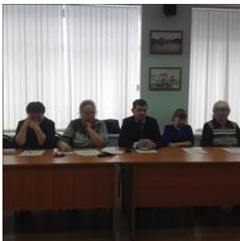
Круглый стол «О ходе реализации мероприятий по проведению независимой оценки качества оказания услуг На круглом столе рассмотрен вопрос: «Обеспечение инвалидов техническими средствами реабилитации и лиц,