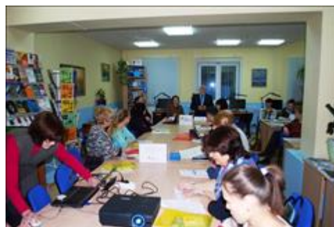
Семинар «Оказание социальных услуг негосударственными поставщиками: практики и технологии» Участники семинара представители социально-ориентированных некоммерческих организаций из Ленского района, Коряжмы, Котласа, Вельска, Коноши, Нядомы, Северодвинска и Архангельска.