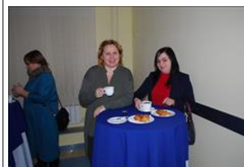
Семинар «Оказание социальных услуг негосударственными поставщиками: практики и технологии» кофе - перерыв для участников семинара