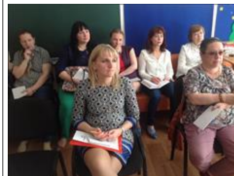
Семинар в Архангельске по обмену опытом поставщиков социальных услуг 17-18 мая Участники семинара - практикума приняли решение о создании ассоциации поставщиков социальных услуг

Электронные версии материалов (бюллетеней, брошюр, буклетов, газет, докладов, журналов, книг, презентаций, сборников и иных), созданных с использованием гранта в отчетном периоде (при условии, что такие материалы не содержатся в