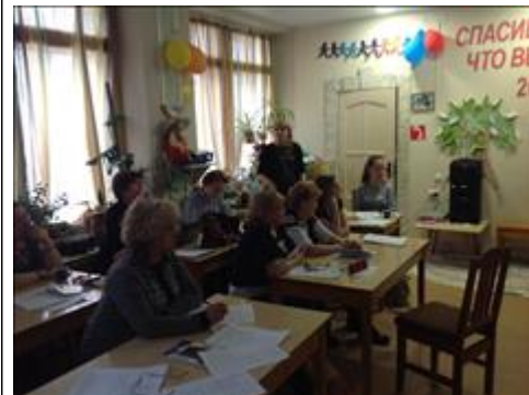
Семинар в Северодвинске по обмену опытом поставщиков социальных услуг 19-20 апреля Слушатели обсуждают организацию работы по подготовке первичной документации и оформлению договоров с получателями