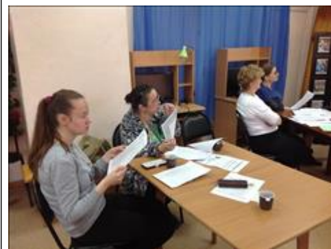
Семинар в Северодвинске по обмену опытом поставщиков социальных услуг 19-20 апреля Участники семинара изучают стандарты социальных услуг, реализуемые в Архангельском региональном отделении Всероссийского общества глухих